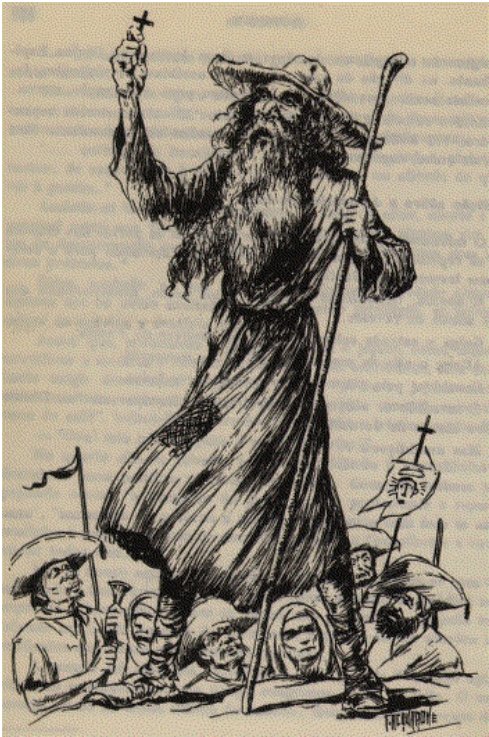
Gravura de Antonio Conselheiro